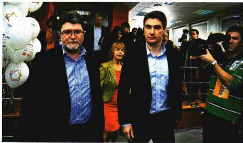
Tonino Picula i Zoran Milanović već dugo uopće ne komuniciraju, što dovoljno govori o odnosima u stranci

se ovaj proces ipak neće preliti preko ruba niti oteći kontroli. U svojih 25 godina SDP je već bio u situacijama kada su neslaganja u vodstvu ili nezadovoljstvo članstva prijetili erupcijama, pa i podjelom stranke, ali uvijek smo znali stati prije crte iza koje više nema povratka. Međutim, u ovakvoj situaciji još nismo bili. Nikad se na ovakav način nismo suočavali s posljedicama jedne autoritarne politike koja na kraju, ipak, nije došla dovoljnu potporu građana, a sada je otvoreno pitanje i hoće li dobiti prolaz kod članstva.